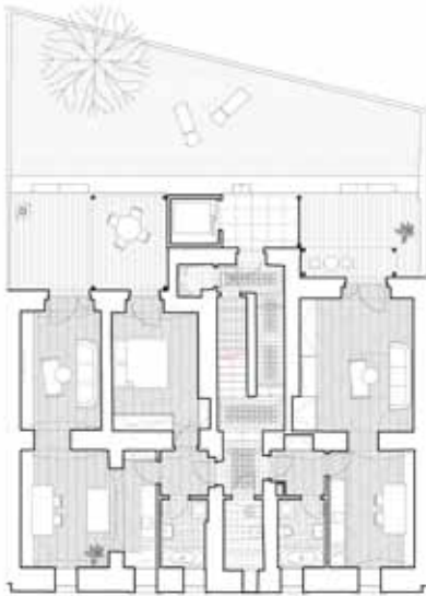
Půdorys 1. PP