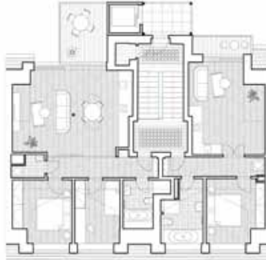
Půdorys 4. NP

Místo stavby / Building location: Šlikova, Praha 6 Autoři / Architects: BY architects / Markéta Zdebská, Marek Žáček Zastavěná plocha / Built-up area: 194 m 2 Hrubá podlažní plocha / Gross floor area: 861 m 2 Plocha pozemku / Plot area: 291 m 2 Obestavěný prostor / Volume: 2860 m 3 Projekt / Design phase: 2022–2023 Realizace / Implementation: 2023–2024