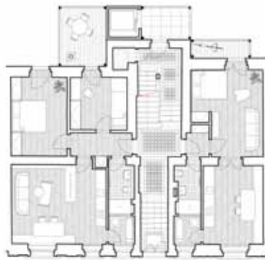
Půdorys 1. NP